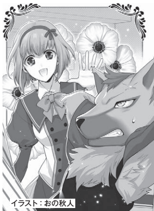
イラスト：おの秋人