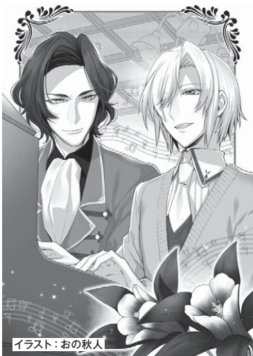
イラスト：おの秋人