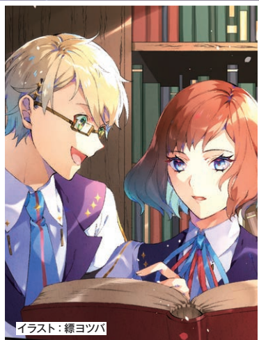
イラスト：縹ヨツバ

このふたつが、『銀剣のステラナイツ』において他の参加者と“最高の物語”を作るための特徴です。