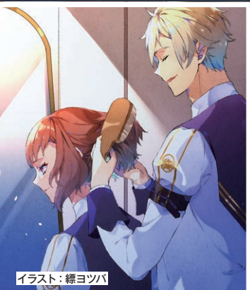
イラスト：縹ヨツバ

『銀剣のステラナイツ』では、「騎士達の日常」と「人類の命運をかけた決闘」の2パートでゲームが進みます。